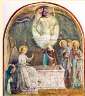
Фра Беато Анжелико. Воскресение (фреска из монастыря Сан Марко, Флоренция, сер. XV в.)

О традициях, связанных с Православной Пасхой, читайте на сайтах https://www.interfax-russia.ru/kaleidoscope/pasha-sut-prazdnika-i-tradicii ; pravmir.ru/pasha-v-2024-godu/ .